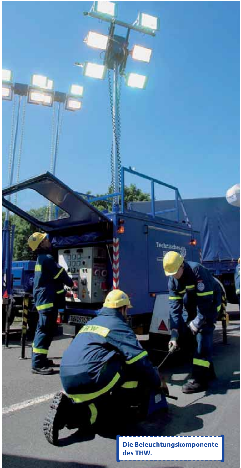
Die Beleuchtungskomponente des THW.