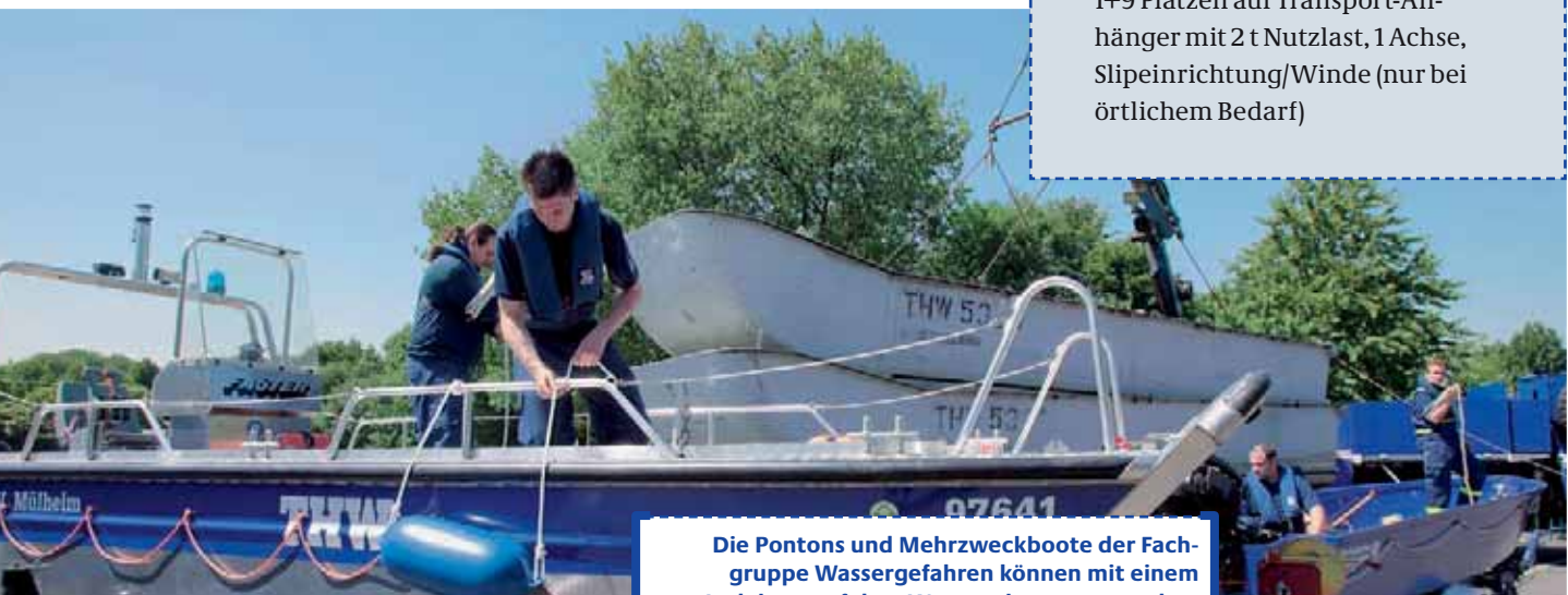
Die Pontons und Mehrzweckboote der Fachgruppe Wassergefahren können mit einem Ladekran auf dem Wasser abgesetzt werden.