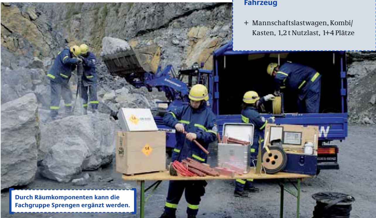
Durch Räumkomponenten kann die Fachgruppe Sprengen ergänzt werden.